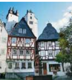
Bad Schwalbach – Kurhaus